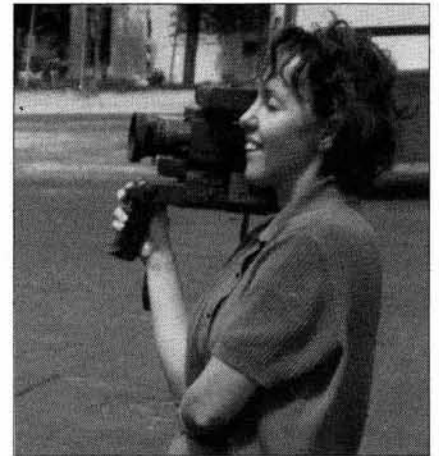
Ihre Vorliebe für Afrika-Reisen weiß sie geschickt mit ihrer Berufswahl zu verbinden.