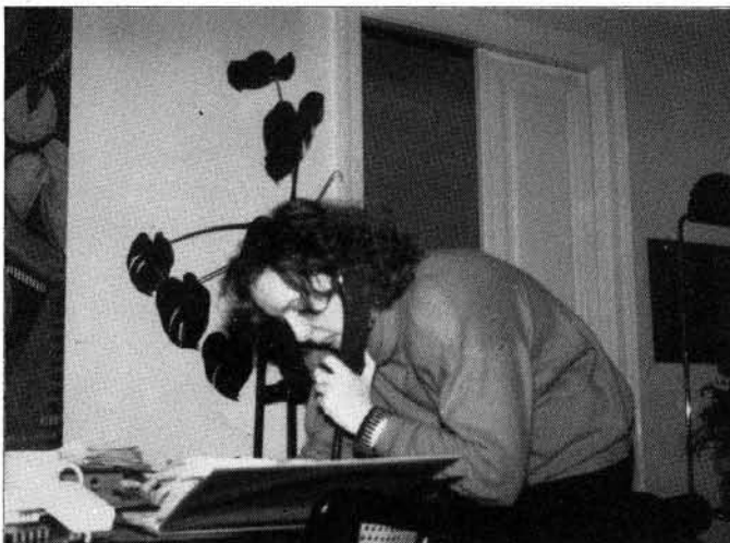
Telefonate sind das Um und Auf

Diese Fotos und Informationen stammen vom 17. und 18. Februar, jeweils zwischen 13 und 14.30 Uhr.