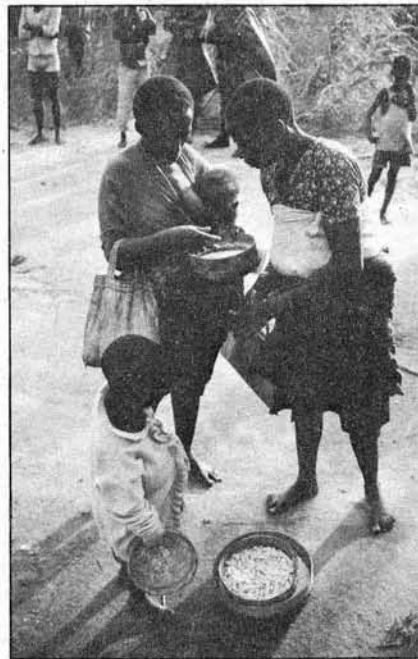
Elend statt Gold

oder Lehrer, die Portugiesen verließen das Land - mit Kapital und Arbeitskraft. Aber Fachleute aus der ganzen Welt kamen - viele exilierte Lateinamerikaner, Menschen aus Ost und West. Mocambique ist ein großes (zehnmal so groß wie Österreich) und fruchtbares Land mit einer 2.000 km langen, fischreichen Küste, mit Infrastruktur für Eisenbahnen und Häfen (der Transithandel war ein Drittel der Staatseinnahmen in der Kolonialzeit). Der Optimismus war trotz allen Schwierigkeiten also groß. Doch die rhodesische Armee begann, Mocambique zu bombardieren, um die Hilfe an die Befreiungsbewegungen an Zimbabwe zu stoppen. Doch auch Zimbabwe wurde unabhängig. Ab ca. 1980 übernahm Südafrika die Rolle des Zerstörers. Von Südafrika ausgebildete und finanzierte Söldnertruppen, bewaffnete Banditen genannt, versuchten, das Land in ein politisches und wirtschaftliches Chaos zu stürzen. Heute sind zwei Millionen Mocambicaner auf der Flucht, vier Millionen von