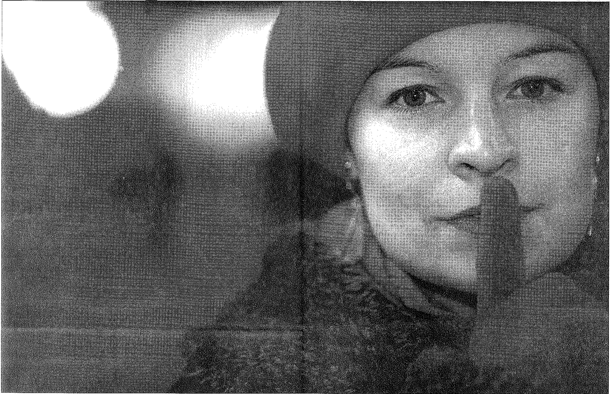
Puhumattomuus kertoo omaa tarinaansa.

Aurinko nousee Turussa klo 9.39 ja laskee klo 15.26. Pimeys päättyy klo 8.40 ja alkaa klo 16.25. Huomenna aurinko nousee klo 9.39 ja laskee klo 15.28. Huomenna pimeys päättyy klo 8.40 ja alkaa klo 16.26.